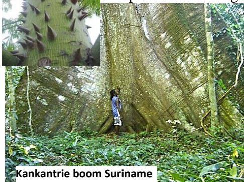
Kankantrie boom Suriname

beschoren.” De boomwortels hebben in deze religies contact met de ‘onderwereld’ en de takken reiken tot in de hemel. De boom wordt dan ook vaak gezien als een verbinder, bemiddelaar tussen goden en mensen. In