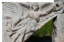
Nikè, de godin van de overwinning