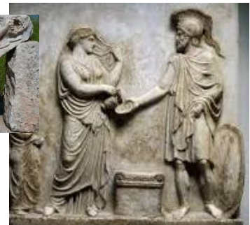
Ares de oorlogsgod

....want toen ik door uw stad liep en de voorwerpen uwer verering aanschouwde, heb ik ook een altaar gevonden met het opschrift: Aan een onbekende god . Wat gij dan, zonder het te kennen, vereert, dat verkondig ik u. De God, die de wereld gemaakt heeft en al wat daarin is, die een Heer is van hemel en aarde, woont niet in tempels met handen gemaakt, en laat Zich ook niet door mensenhanden dienen, alsof Hij nog iets nodig had , daar Hij zelf aan allen leven en adem en alles geeft. Hand 17:23-25