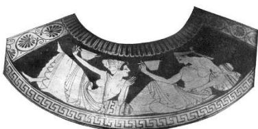
Hetaere eufemisme voor courtisanes

Dus moeten we kijken in de niet-Bijbelse literatuur van die dagen ... Doen we dat, dan blijkt het woord ”authentico” niet alleen de betekenis van MACHT .... maar ook blijkt te maken te hebben met seksuele betrokkenheid c.q. betekenis. De enige vrouwen welke in die dagen les gaven waren de .....HETAERES... Minnaressen van de rijken, welke vaak dienst deden in de tempels als ‘docenten’ van de prostituees ... Na de lessen van de HETAERES... stelde zij zich beschikbaar ....deze gemeenschap werd tevens gezien als gemeenschap met