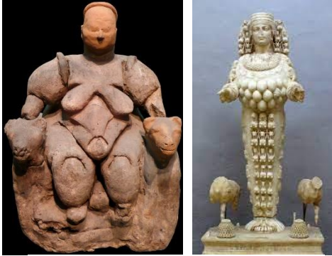
Beelden van vruchtbaarheidsgoden

Een andere reden waarom God Zich vermoedelijk als man heeft geopenbaard kan zijn dat de Kanaänietische volken HUN GODSDIENST sterk vermengd hadden of toegespitst tot een vruchtbaarheidscultus ....Astarte...Asjera .etc. (vrouwen) Maar onze God, de God van de Bijbel stijgt duizelingwekkend ver boven alle aardse begrippen uit.... Aan God lag het dus niet, maar voor mannen was/is het moeilijk het gevoel van eigenwaarde los te zien van hun neerbuigende houding naar vrouwen. De man voelde zich bedreigt hetgeen dan uitloopt in een bedreigend stelling nemen, vijandigheid.