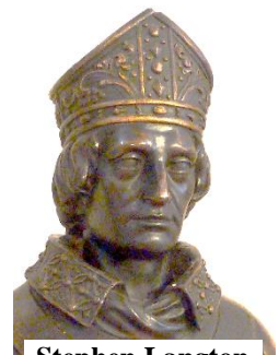
Stephen Langton 1150 1228

Dus deze onderworpenheid dienen alle christenen aan elkaar te tonen een liefde welke zijn oorsprong vindt in deze opofferende liefde van Christus.. Paulus gebruikt hier duidelijk het voorbeeld van onze Heer en Heiland. We hebben al gezien dat "hoofd" OORSPRONG c.q.