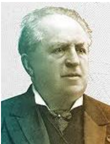
Abram Kuyper 1837-1920

Ouders laden schuld op zich als ze uit zachtheid of toegeeflijkheid, geen gehoorzaamheid van de kinderen vragen. Dit kwaad begint men dan te voeden bij zijn jongere kinderen, die als ze ongehoorzaam zijn door allerlei beloften worden gepaaid en overgehaald, om het toch maar te doen, en als ze het toch niet doen, ontzien worden, omdat men bang is om ze te straffen. En is zo'n kind eigenzinnig opgegroeid, aan geen gehoorzaamheid gewend, haast er toe opgeleid, om alleen te doen wat het zelf inziet dat moet.